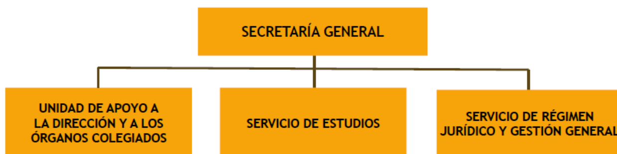
ESQUEMA 2.1. ORGANIGRAMA DE LA SECRETARÍA GENERAL DEL CES

La composición de la relación de puestos de trabajo (RPT) de la Secretaría General del CES se detalla en las siguientes tablas: