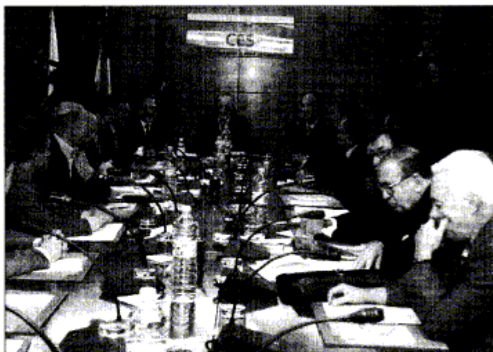
Adán Martín presidió ayer la reunión del Consejo Económico y Social.

Asimismo, el documento aprueba que las regiones que salgan del Objetivo 1 por haber superado el límite del 75% de la renta media europea, como ocurre con Canarias según los datos aportados ayer mismo por la oficina de estadística de la UE, Eurostat, pueda seguir accediendo a ayudas «a partir del artículo 87.3a, que es el mayor nivel de ayudas, y no establece un límite, a diferencia de lo que dice con respecto a las zonas que salen del Objetivo 1 por efecto estadístico a las que da un plazo de dos años». El presidente canario lo interpreta como «la