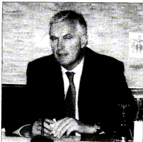
Michel Barnier, comisario europeo de Política Regional.

Michel Barnier destacó el "caso particular" de las regiones ultraperiféricas (RUP) e instó a estos territorios a "pasar de la cultura de ventanilla a la cultura de proyectos".