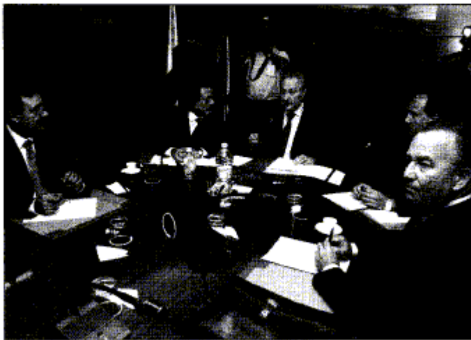
El presidente del Gobierno, Adán Martín, en la reunión del Consejo Económico y Social (CES).

Martín aseguró que la UE garantiza que exista un "instrumento específico" para atender las necesidades y problemas de las RUP y por el que se prevén políticas de cooperación con los países vecinos. El jefe del Ejecutivo regional reconoció que este informe de cohesión incluye partes "muy importantes" referidas al funcionamiento del Estado y a la inversión, recogiendo las vitales ayudas al transporte y al Régimen Económico y Fiscal (REF) de Canarias, algo que "permite