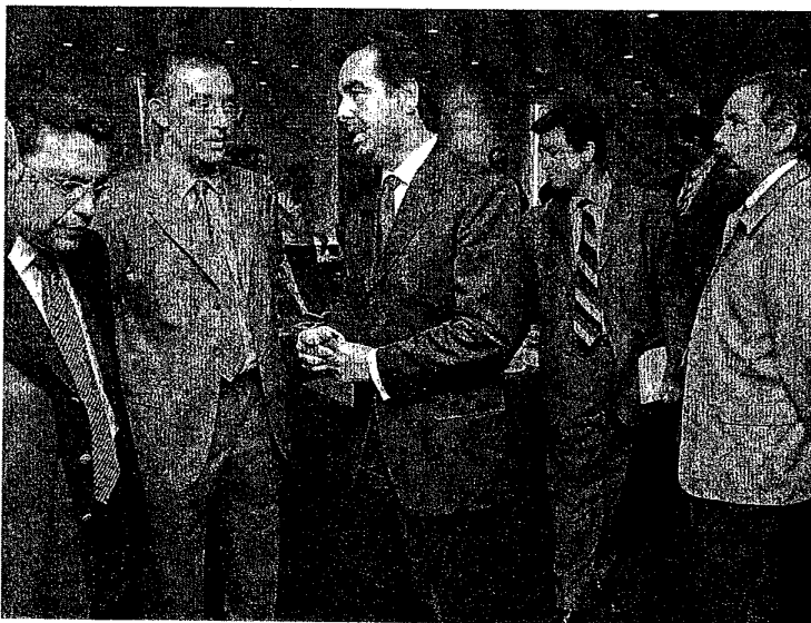
Luis Soria junto al presidente de la Zona Franca y de empresarios, ayer, en la capital grancanaria.

El jefe del Ejecutivo canario anunció el desbloqueo del denominado decreto de los sistemas extrapeninsulares durante la celebración de las Jornadas sobre desarrollo industrial de Canarias