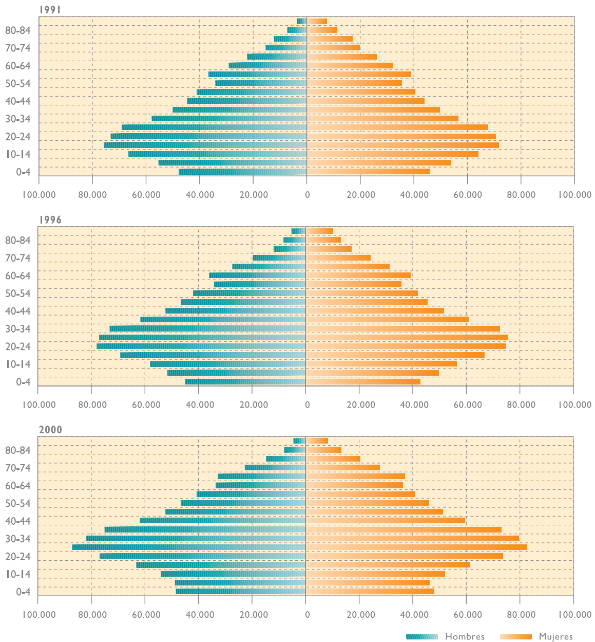
Gráfico 3. Pirámides de población de Canarias. Canarias, 1991, 1996 y 2000

¿Qué es lo común y lo específico de la trayectoria que ha seguido el crecimiento vegetativo de la población canaria? Con respecto a los países de la Unión Europea son evidentes las diferencias. En síntesis, y al igual que ocurrió en el resto del Estado, una transición demográfica mucho más tardía. Con respecto a las demás comunidades autónomas, los rasgos de la falta de modernidad son más acentuados.